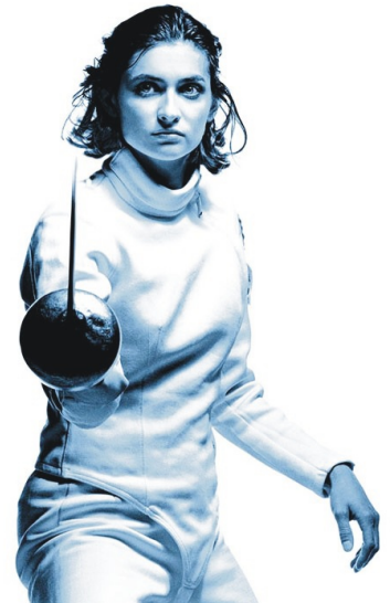
Die mehrfache Olympia-, WM- und EM-Medaillengewinnerin Gianna Hablützel-Bürki ist Ihre Gastgeberin.

Anfragen bitte an Tel. 079 674 64 41 oder via www.habluetzel-buerki.ch oder www.baselriehenscorpions.ch